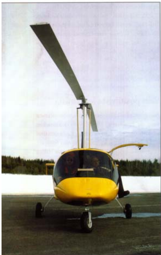
Autogiron suurikehäinen roottori on hankala hallittava maassa. Kaatumisvaaran pienentämiseksi Xenonin laskutelineen raideväli on levitetty peräti 220 senttimetriin.

Myös pyöriiväsiipisen käsittelyssä maassa on omat niksinsä. Suurikokoisen roottorin ulottuvuuksista on etenkin lähtökiidossa ja laskuissa enemmän huolta kuin jäykästi paikallaan pysyvistä siivenkärjistä. Pahimmillaan roottori voi viedä konetta, eikä parisataa kierrosta minuu-